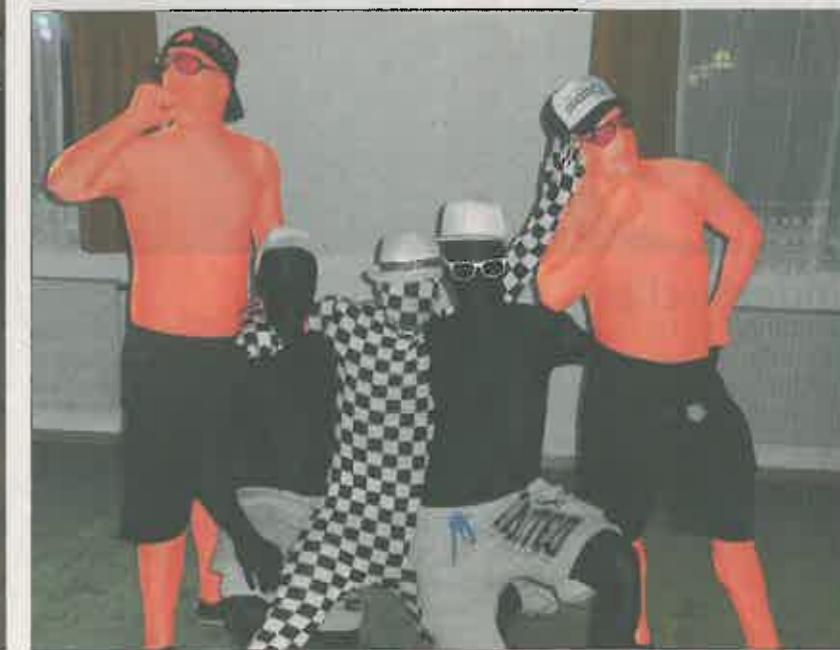
Die mit Abstand originellste Verkleidung hatten diese fünf jungen Fußballer.

Band „Isar 3“ sorgte gleich von Beginn an für beste Partystimmung. Insgesamt vier Einlagen standen in diesem Jahr auf dem Programm beim Sportlerball: Drei davon wurden von den Fußballern des FC aufgeführt und auch die Band „Kiss“, bereits bekannt vom Frauenfasching, glänzte erneut mit ihrem Auftritt. Bei der traditionellen Schnaps-Polonaise war die Stimmung auf ihrem Höhepunkt und das närrische Fußballervolk feierte noch bis in die frühen Morgenstunden.