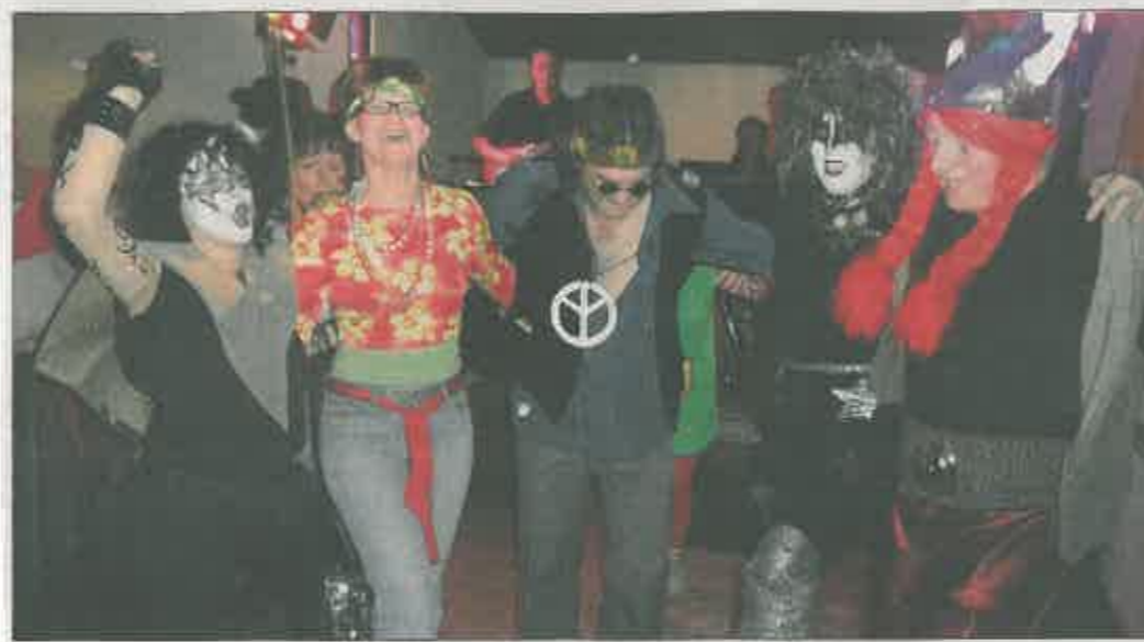
Ausgelassen feierten die Besucher bis in die frühen Morgenstunden.